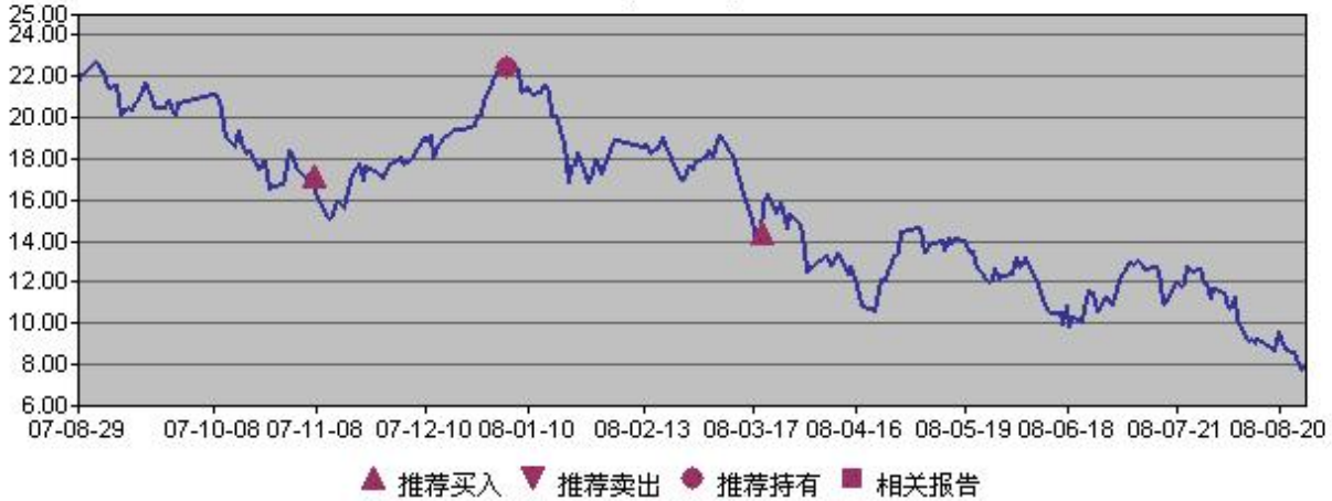
中国国贸(600007)行情走势